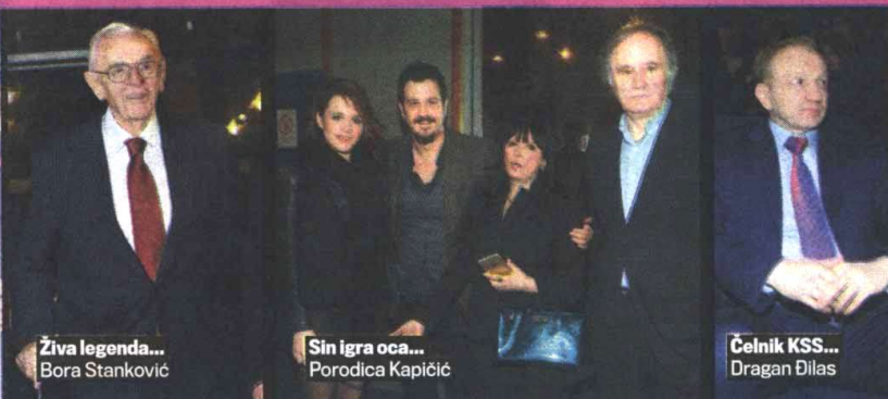
Živa legenda... Bora Stanković